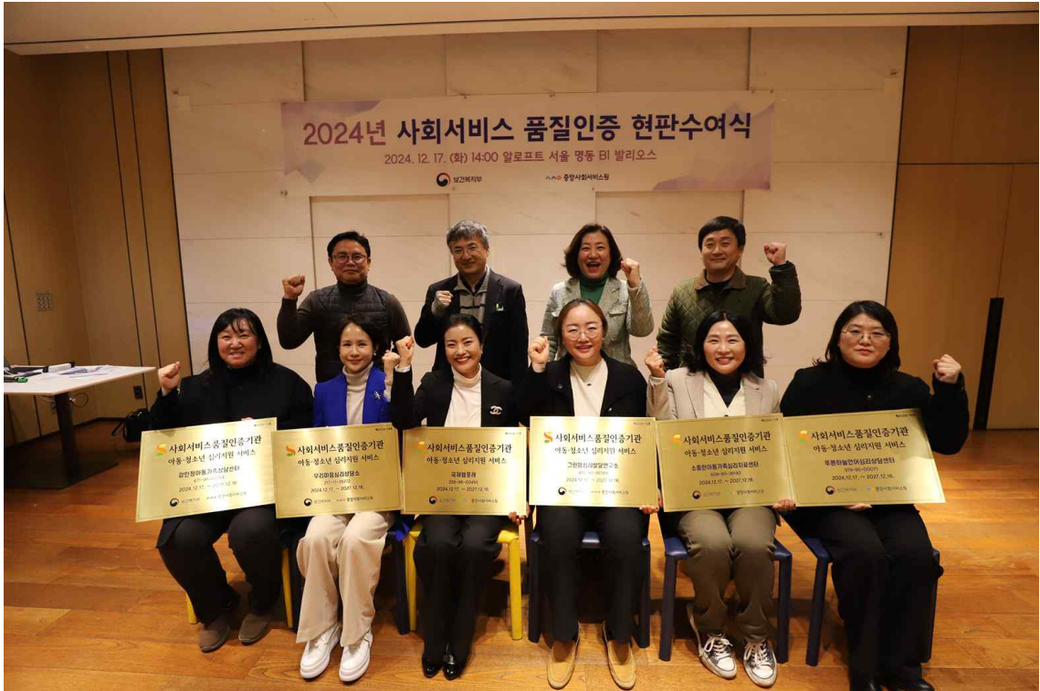
사회서비스 품질인증 현판수여식 단체사진(아동·청소년 심리지원 서비스)