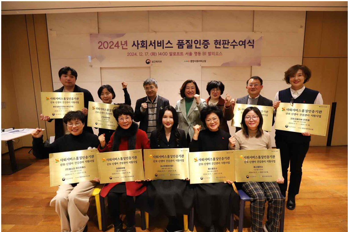
사회서비스 품질인증 현판수여식 단체사진(산모신생아 건강관리 지원사업)