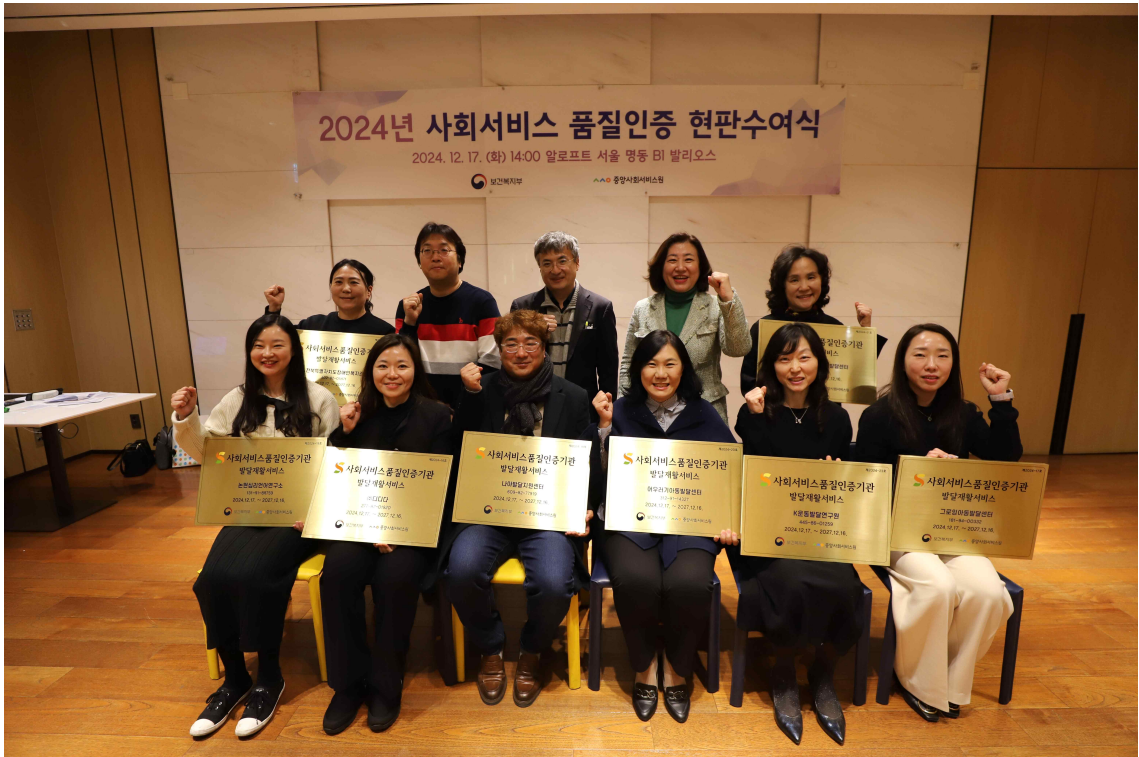
사회서비스 품질인증 현판수여식 단체사진(발달재활 서비스)