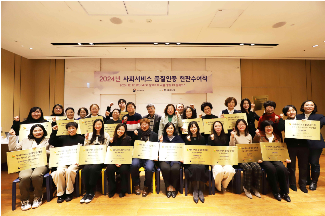
사회서비스 품질인증 현판수여식 단체사진(전체)